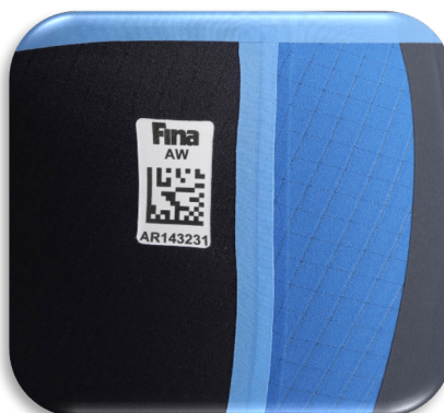
Couture soudée ou collée